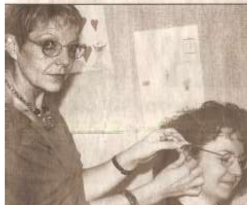
appareiller est le meilleur moyen de communiquer avec l'autre.

A la question que veut dire le mot malen-