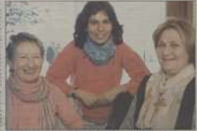
Les membres de l'Association fribourgeoise des malentendants (AFM) lors d'une réunion.

N ous sommes tous des malentendants en puissance. C'est ce que veut dire l'Association fribourgeoise des malentendants (AFM) lors de sa campagne de sensibilisation pour la Journée de l'audition, le 10 mars prochain. L'association, créée en 1978, a pour but de sensibiliser le public à ce handicap, qui frappe des gens de tous âges. 110 ans l'accent sur l'intégration sociale et la communication.